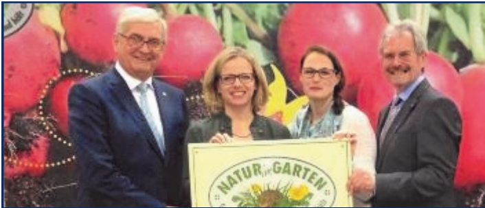
Auszeichnung als „Natur im Garten“-Gemeinde

„Natur im Garten“ ist eine bekannte Initiative des Landes NÖ. Die Kernkriterien dieser Aktion legen fest, dass Gärten und Grünräume ohne Pestizide, ohne chemisch-synthetische Dünger und ohne Torf gestaltet und gepflegt werden. Wer die Plakette "Natur im Garten" an seinen Zaun heften möchte, hat strenge Kriterien zu erfüllen. Es wird großer Wert auf biologische Vielfalt und Gestaltung mit heimischen und ökologisch wertvollen Pflanzen gelegt.