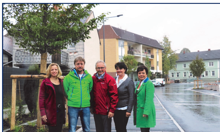
Bepflanzung des neuen Hauptplatzes

Zunächst hoffe ich, dass Sie die wunderbaren Sommermonate auch ein wenig zur Erholung nutzen konnten. In der Gemeindegarbeit wurden die anstehenden Projekte fleißig weiterbetrieben. Am Hauptplatz sind die beiden ersten Bauabschnitte inklusive Bepflanzung fertiggestellt, die LED Umstellung bei der Straßenbeleuchtung wurde abgeschlossen und der Gehsteig entlang des Durlaßbaches wurde errichtet. Das Geländer ist noch zu montieren. Darüber hinaus wurden die beiden Straßen Kleegasse und Steinbergblick inklusive Infrastruktur hergestellt und es werden derzeit schon drei Einfamilienhäuser errichtet.