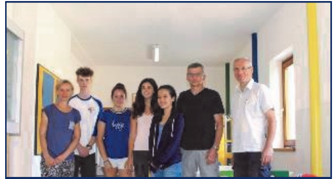
Akustikdecke in der Volksschule

Die Sommerferien wurden in der Volksschule Rohrbach genutzt, um die Arbeiten an der Akustikdecke für den Schallschutz im Obergeschoß des Gebäudes fertig zu stellen. Insgesamt beliefen sich die Kosten für Trockenarbeiten (Firma Artner), Malerarbeiten (Firma Wurzinger) und Elektroarbeiten (Firma iTECH) auf etwa 15.000 Euro. Durch die Akustikdecke wird ein erheblicher Anteil an Schall vermindert und dadurch das Lernklima der Schulkinder, als auch die Arbeitsbedingungen der Pädagoginnen durch geringere Lärmpegel erleichtert.