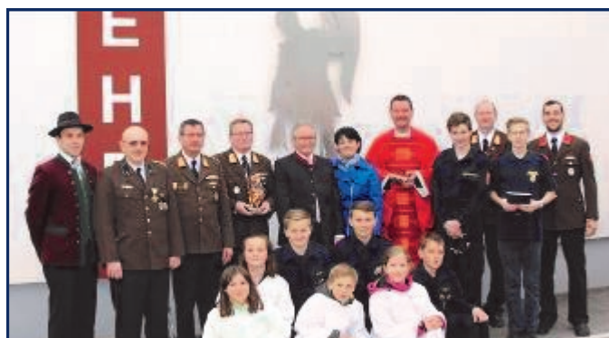
Segnung des Hl. Florian