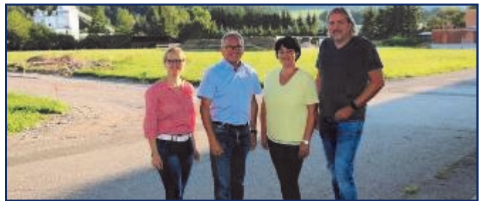
Aufschließung Steinbergblick und Kleegasse

Auch der Straßenunterbau wurde hergestellt und die Straßenbeleuchtung errichtet. Kostenpunkt: € 70.000.--