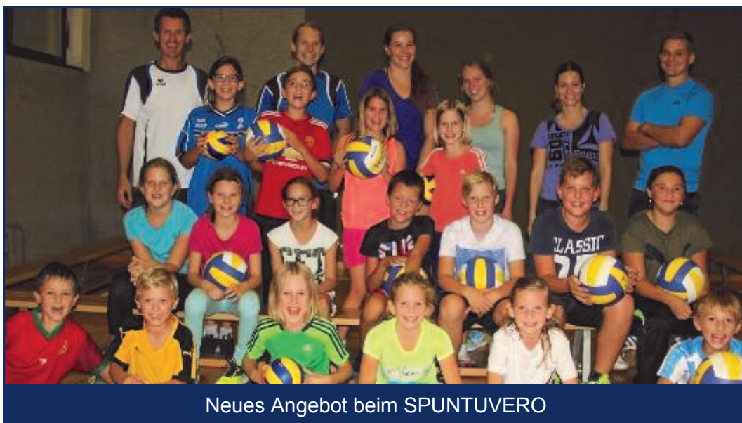
Neues Angebot beim SPUNTUVERO