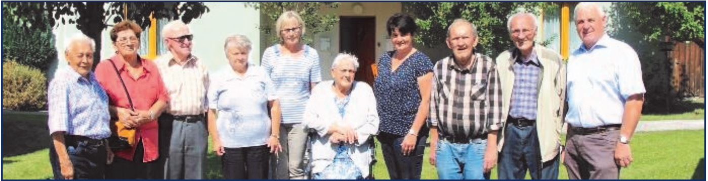
VertreterInnen der Gemeinde mit BewohnerInnen der Seniorenwohnanlage