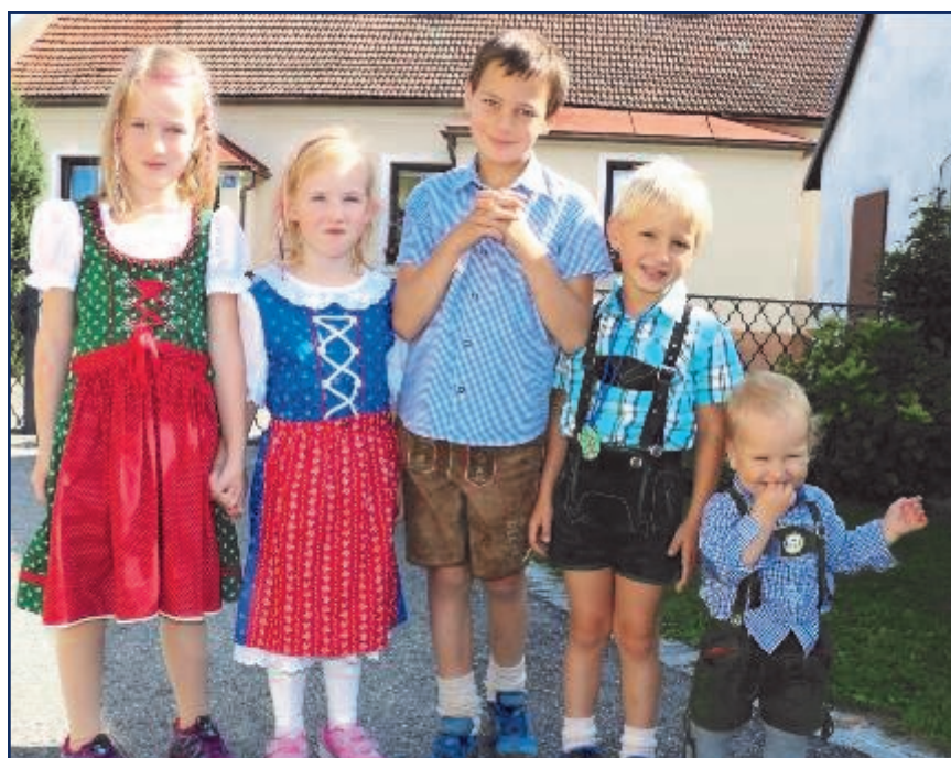
Dirndlg'wand Sonntag in Rohrbach

Zum landesweit durchgeführten "Dirndlg'wand - Sonntag" lud auch die Gemeinde Rohrbach.