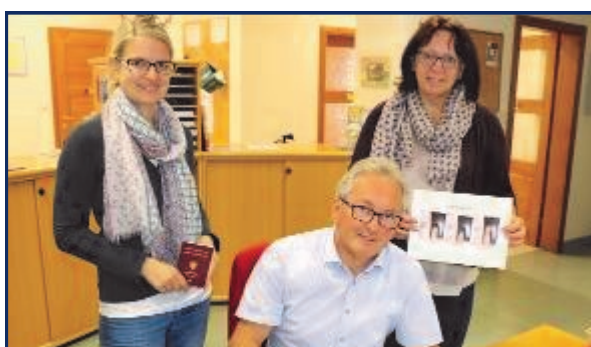
Neues Service beim Gemeindeamt

In der Praxis sieht es so aus, dass die Daten in der Gemeinde aufgenommen und an die Bezirkshauptmannschaft Lilienfeld übermittelt werden. Das Dokument (Reisepass oder Personalausweis) wird den Antragstellern am Postweg nachhause übermittelt. Mit einer Wartezeit von mind. 14 Tagen bis zum Erhalt des neuen Passes sollte allerdings gerechnet werden. Not- oder Expresspässe können nur über die BH Lilienfeld beantragt werden. Anträge bitte nur am Vormittag einbringen!