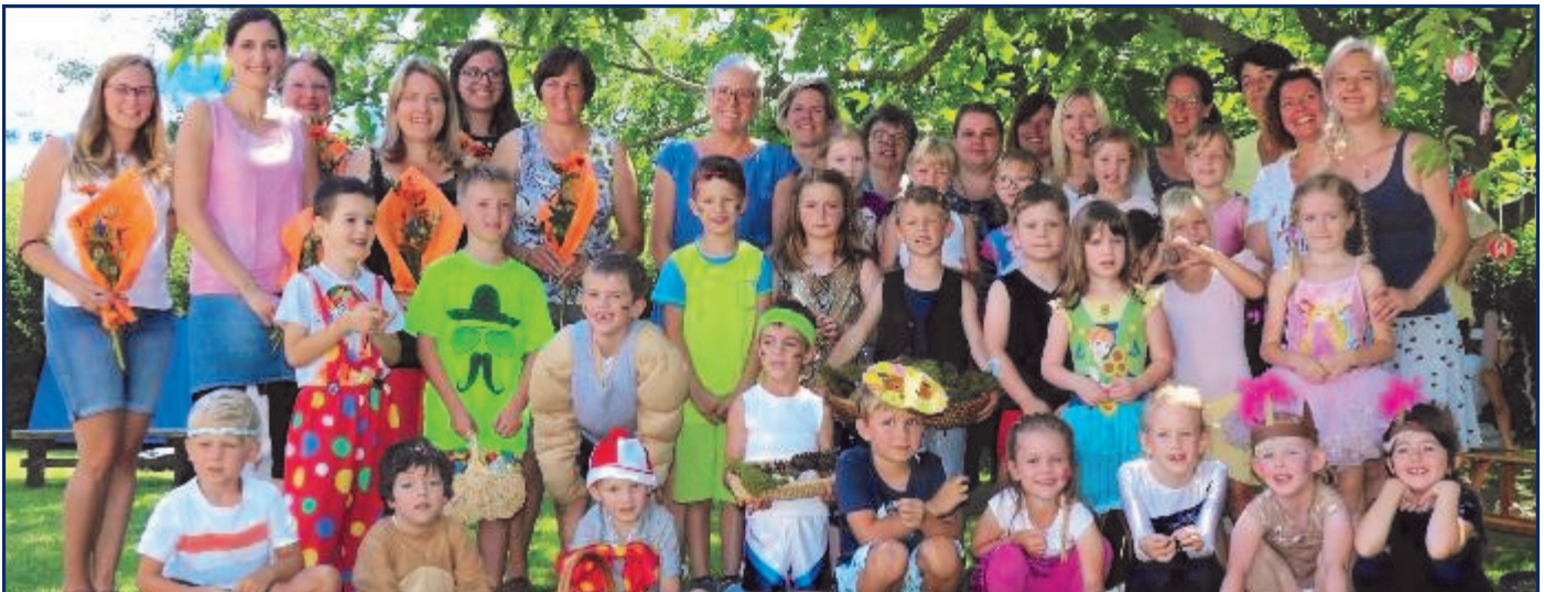
Sommerfest im Kindergarten

„Manege frei für Zirkus Kunterbunt“ war das Motto beim Sommerfest im Kindergarten. „Mitwirkende Akrobaten waren unsere Kinder und für die Verpflegung sorgte der Elternbeirat“, informiert Kindergarten-Leiterin Renate Kühberger.