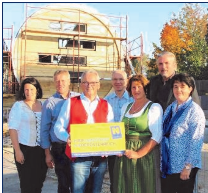
Besichtigung vom „Rohr am Bach“

Großes Thema war die Belebung und Entwicklung des Dorfbereichs. Das Großprojekt „Hauptplatz neu“ wurde der interessierten Exkursionsgruppe von der Planung bis zur Umsetzung erläutert.