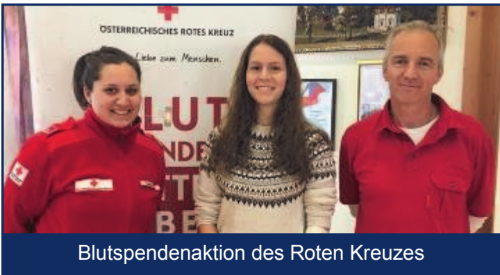
Blutspendenaktion des Roten Kreuzes