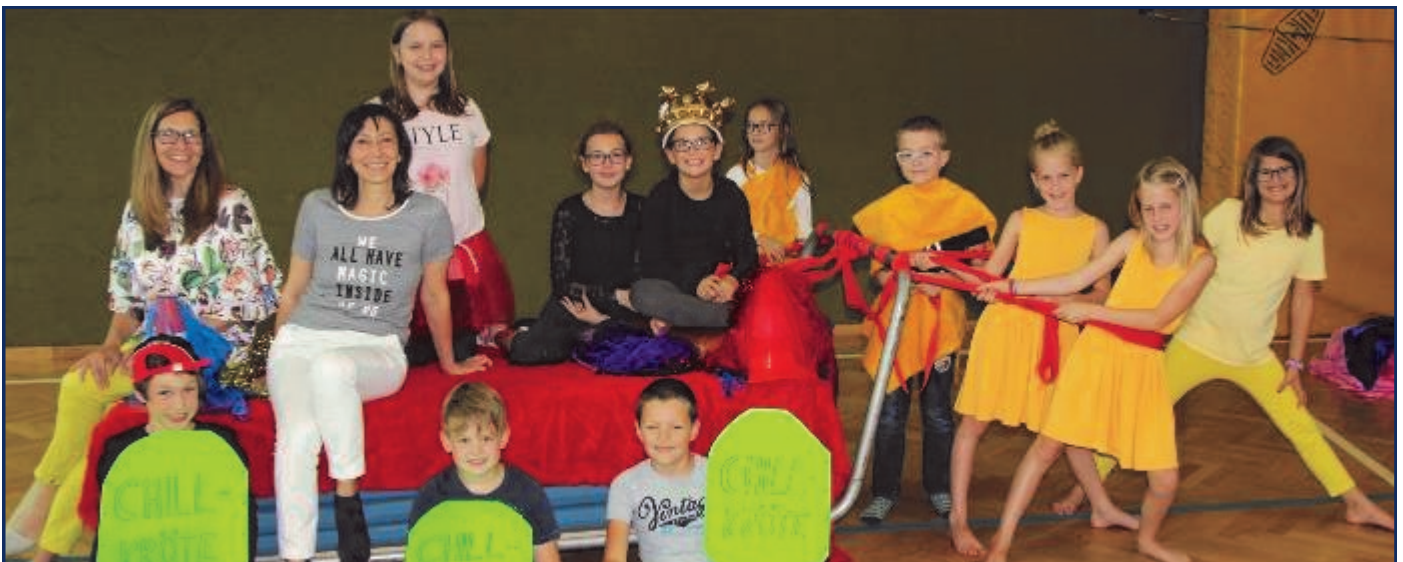
Gemeinsam wurde das Theaterstück geschrieben und gespielt

„Karneval der Tiere“ hieß das freiwillige Theaterprojekt der 3. und 4. Klassen Volksschule im zweiten Semester des vorigen Schuljahres. Die Lilienfelder Theaterpädagogin Emina Eppensteiner studierte mit den Kindern das Stück ein und im Rahmen eines bunten Rahmenprogrammes, an dem