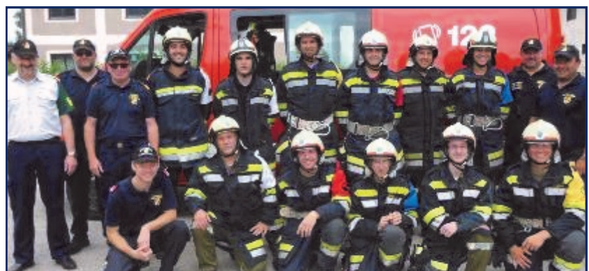
Prüfung erfolgreich abgelegt

Bei dieser Ausbildungsprüfung wird ein Zimmerbrand simuliert. Die Teilnehmer müssen innerhalb einer vorgegebenen Zeit einen Innenangriff mit schwerem Atemschutz erfolgreich durchführen.