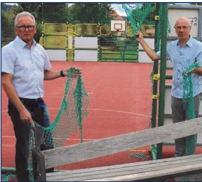
Am Skaterplatz wurden Netze und Bänke zerstört