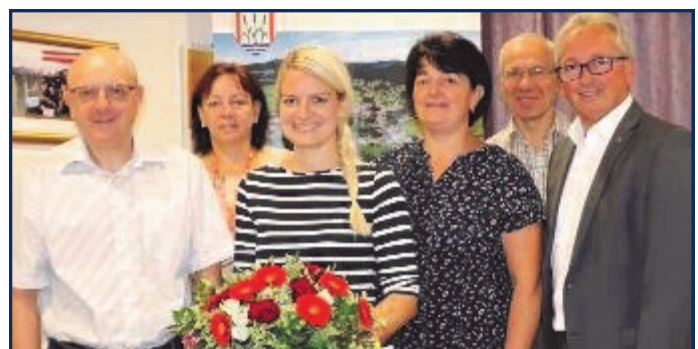
Dienstprüfung erfolgreich abgelegt