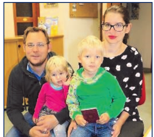
Erste Pässe wurden schon beantragt

Bei Erstantrag sind auf das Gemeindeamt ein amtlicher Lichtbildausweis, Geburtsurkunde und Staatsbürgerschaftsnachweis sowie ein Passbild, nicht älter als sechs Monate, mitzubringen. Gegebenenfalls sind zusätzliche Unterlagen wie Heiratsurkunde, Diplommurkunde eines akad. Grades, Scheidungsurteil und bei Anträgen für Kinder und Jugendlichen gegebenenfalls die Nachweise der Obsorge mitzubringen.