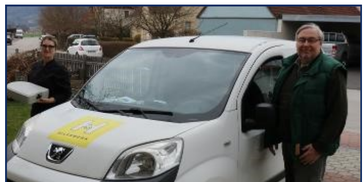
Gasthaus Linsbichler liefert Menüs

Auf Bestellung werden auch Menüs an die Rohrbacher Bevölkerung ausgeliefert. Das Gasthaus Linsbichler selbst ist derzeit geschlossen. Um längere Wartezeiten zu verhindern wird um Vorbestellung bis 17:00 Uhr des Vortages gebeten. Bestellung unter: 0664- 50 40 388