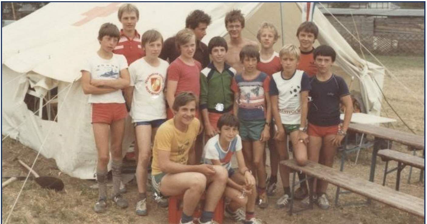
Mitglieder Feuerwehrjugend 1981