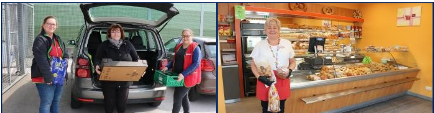
Nah&Frisch Hartmann und die Bäckerei Schindl bieten einen Lieferdienst an

Kaufen Sie so ein, dass Sie mehrere Tage mit den Lebensmitteln auskommen.