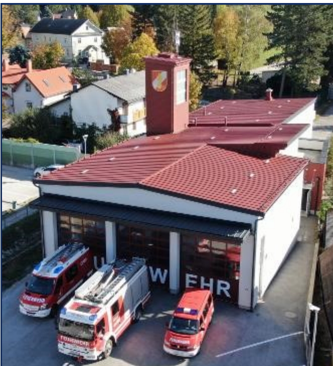
Das neue FF Haus wurde 2014 feierlich eröffnet

1981 wurde ein neues Feuerwehrhaus an jener Stelle bezogen, an der sich auch das heutige, am 14. Oktober 2014 eröffnete Haus befindet.