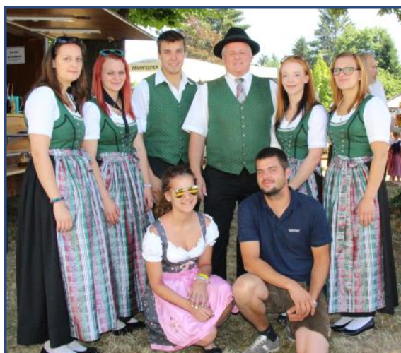
Tag der Tracht