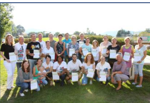
Dank an Vereinsobleute