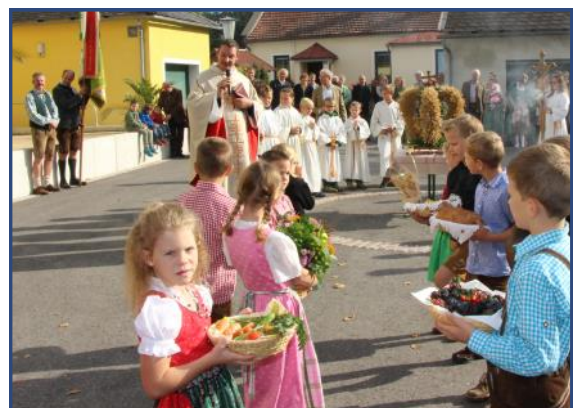
Erntedankfest am Pfarrplatz