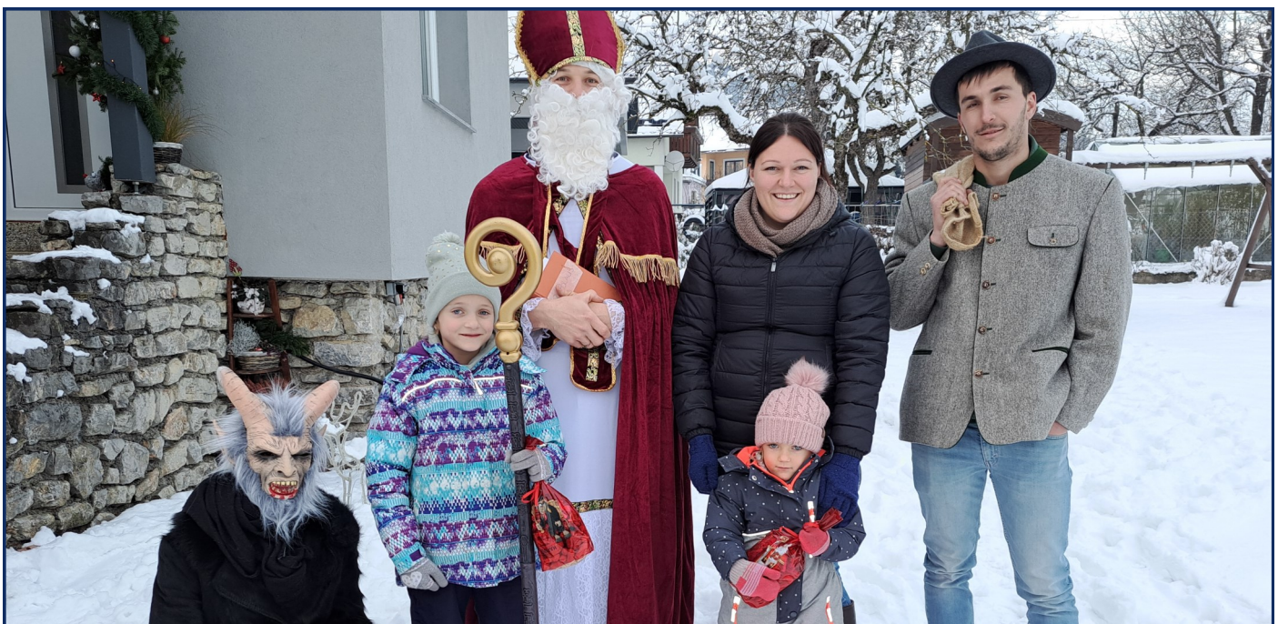
Nikolaus und Krampus besuchten die Rohrbacher Kinder