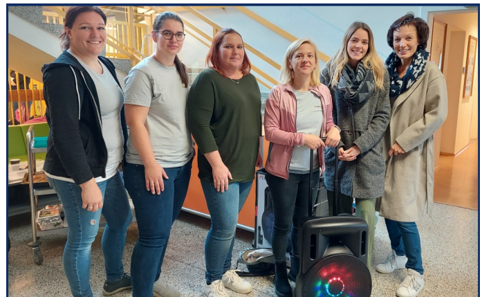
Musikbox wurde übergeben

Der Elternverein stellte sich mit einer mobilen Musikbox mit besonderer Soundqualität plus Mikrophon für diverse Schulfestivitäten ein. Damit steht den zukünftigen Festivitäten ein Top Gerät für das musikalische Rahmenprogramm zur Verfügung.