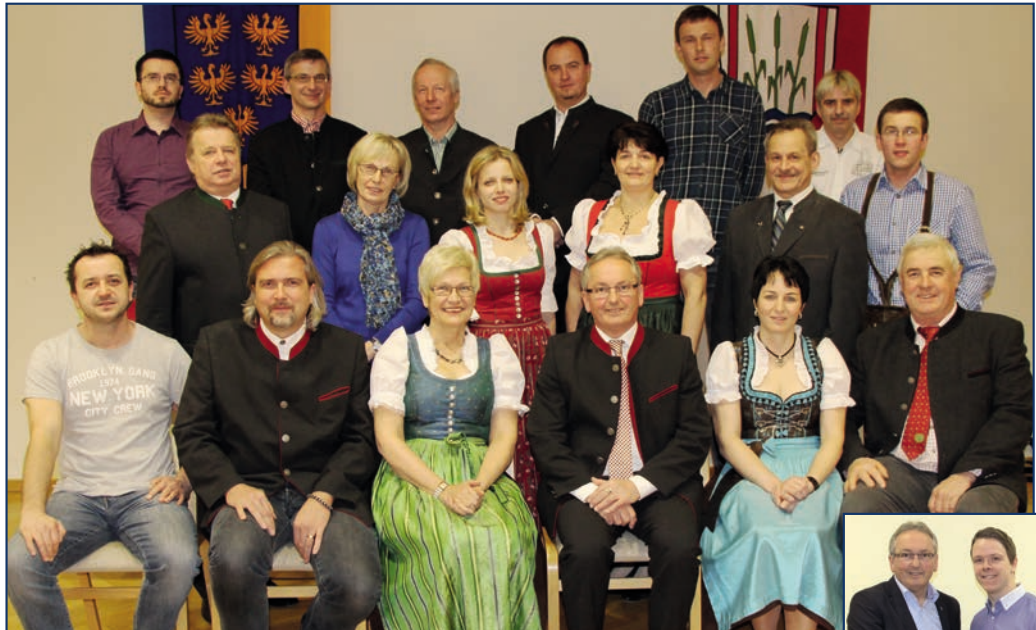
Mitglieder des Gemeinderates 2015