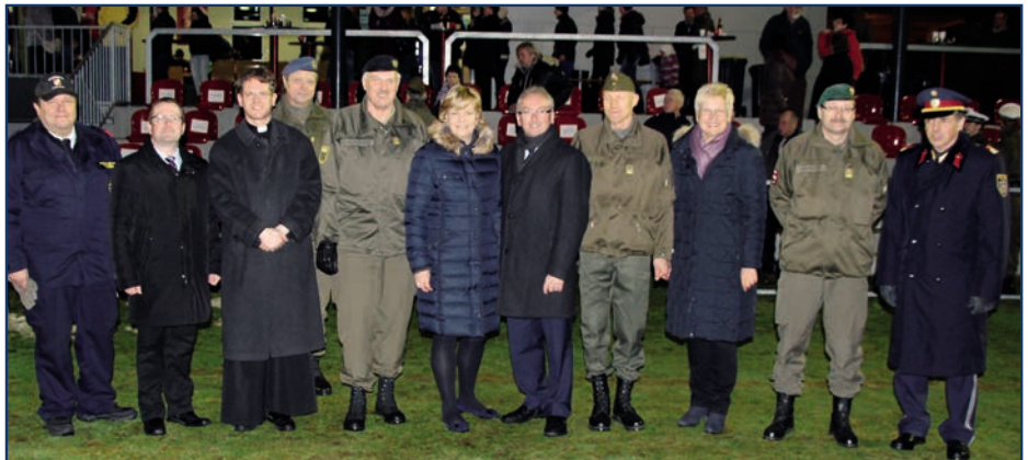
Ehrengäste auf der Liese Prokop Sportanlage