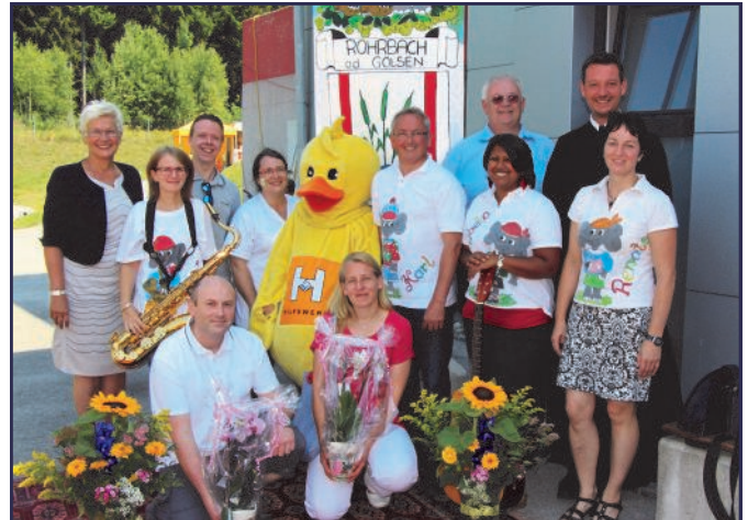
23. Rohrbacher Ferienspiel

Das gesamte Ferienspielprogramm kann man auf der Gemeindehomepage herunterladen: