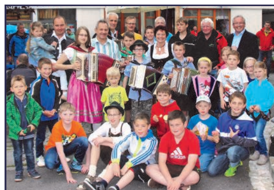
„Lustig war`s“ waren sich die Kinder einig