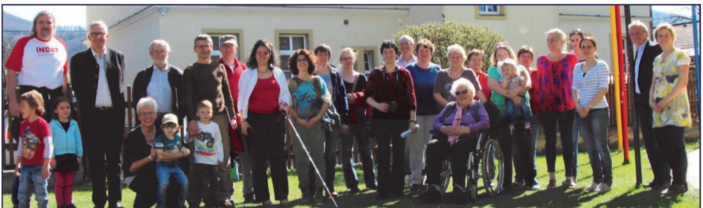
Großes Interesse am Thema Barrierefreiheit

Mitte April fand das Gemeinde21-Projekt „Dorfbegehung barrierefrei“ statt. Ziel dabei war, wesentliche Hürden zu entdecken und zu entfernen , um den Bewohnern die Mobilität zu erleichtern. Der Projektlei-