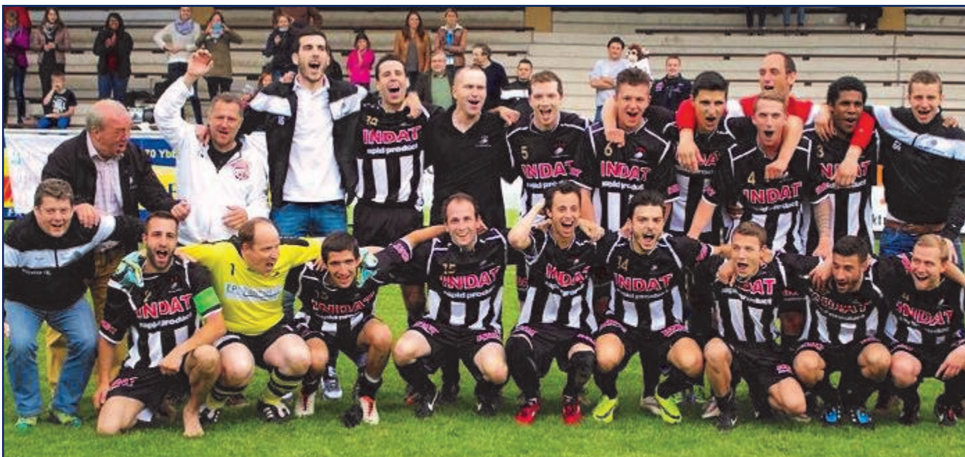
Meistermannschaft 2014/2015 Gebietsliga West

Äußerst erfreulich verlief für den USC IN DAT Rohrbach die letzte Spielsaison. So wurde mit dem Meistertitel in der Gebietsliga WEST ein historischer Erfolg erzielt und unsere Fußballer spielen in der nächsten Spielsaison in der 2. Landesliga West .