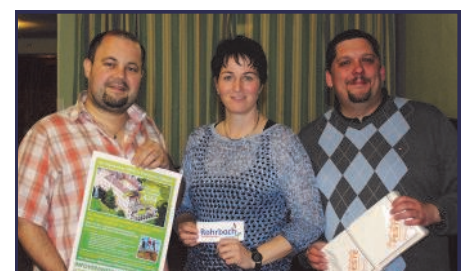
Zwei neue Vereine