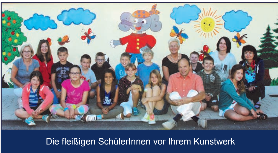
Die fleißigen SchülerInnen vor Ihrem Kunstwerk