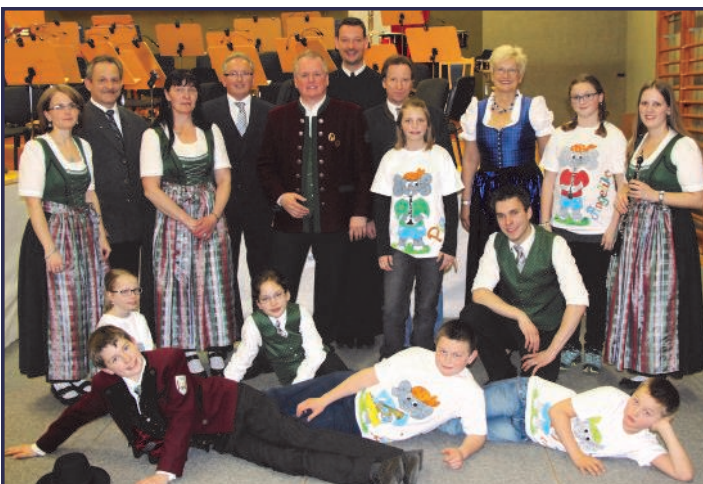
Frühlingskonzert - jedes Jahr ein Hörgenuss

Mit einem grandiosen Frühjahrskonzert bot unsere Jugendblaskapelle am 28. März im Turnsaal der Volksschule den zahlreichen Besuchern ein ganz besonderes kulturelles Highlight .