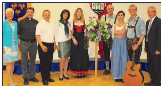
Konzert des 3klang Chores

Mit diesem breitgefächerten Programm führte der musikalische Streifzug von Griechenland bis Amerika. Der Chor begeisterte mit stimmungsvollen und besinnlichen Liedern und Gospels aber auch mit heiteren Volksliedern und Schlager.